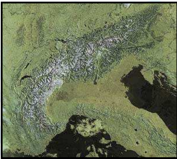
Image par satellite des Alpes en mai 2002.

Il y a 82 sommets majeurs (de plus de 4 000 m d'altitude) : 48 en Suisse, 38 en Italie et 24 en France. Les cols de montagne reliant les vallées ou les pays dépassent souvent les 2 000 m d'altitude.