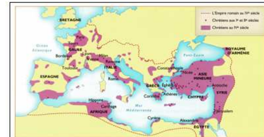
Le christianisme dans l'Empire romain.