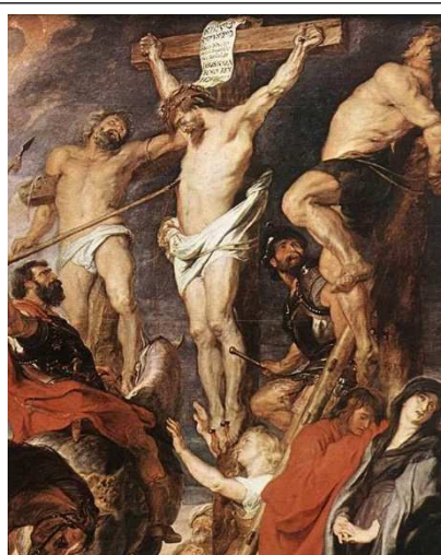
Jésus sur la croix entre deux voleurs, 1620.