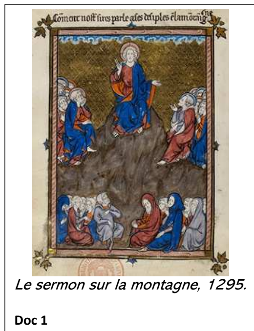
Le sermon sur la montagne, 1295.

Il est accusé par les Romains de troubler l'ordre, et il est mis à mort sur une croix .