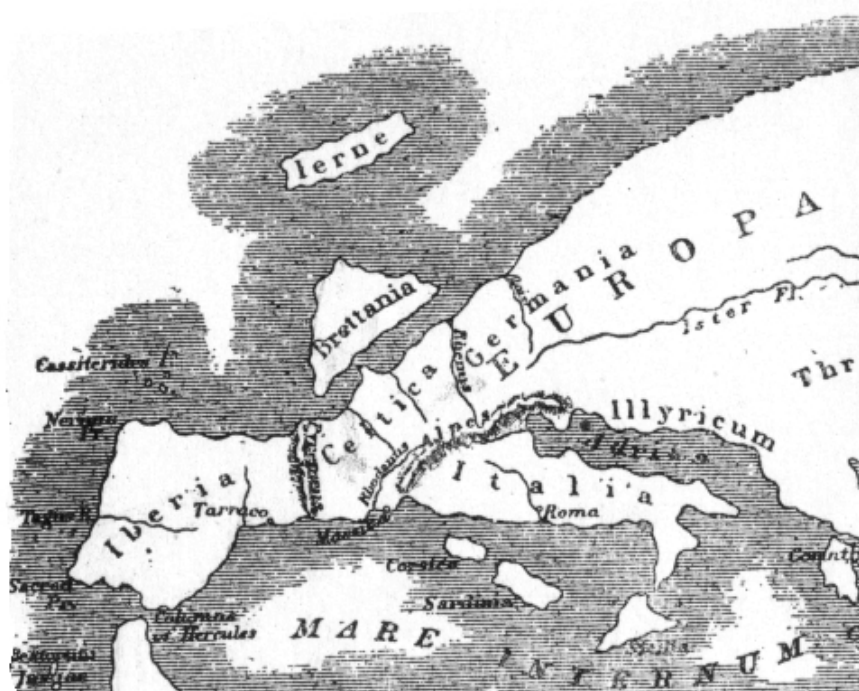
Doc. 4 La carte de l'Europe par Strabon (environ 50 avant J.C.).

Grâce à des explorateurs comme Pythéas, peu à peu, les cartes de l'antiquité sont devenues plus précises .