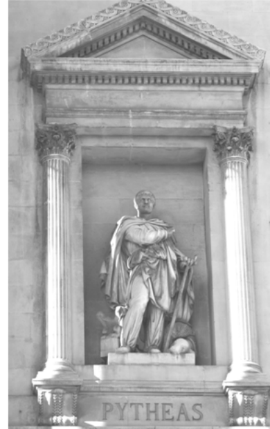
Doc. 2 : Détail de la façade du Palais de la Bourse.

Pythéas était un marchand , mais c'était surtout un grand astronome et un grand scientifique , qui rêvait d'explorer les territoires inconnus.