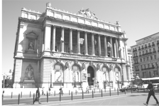
Doc. 1 : Façade du Palais de la Bourse, Marseille.

C'est un grand nom de l'histoire de notre ville.