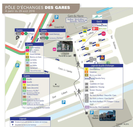
Pôle d'échanges des gares au Havre.

Les moyens de transport se rejoignent dans de grands pôles d' échanges qui permettent de combiner plusieurs modes de déplacement.