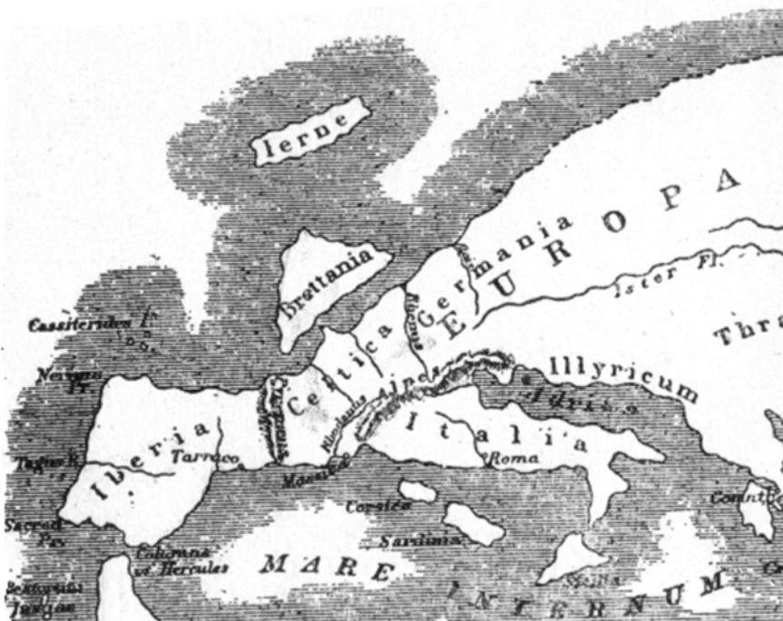
Doc. 4 La carte de l'Europe par Strabon (environ 50 avant J.C.).