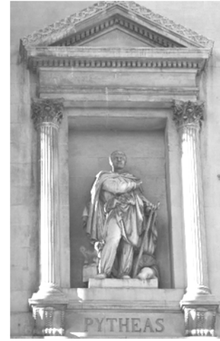
Doc. 2 : Détail de la façade du Palais de la Bourse.