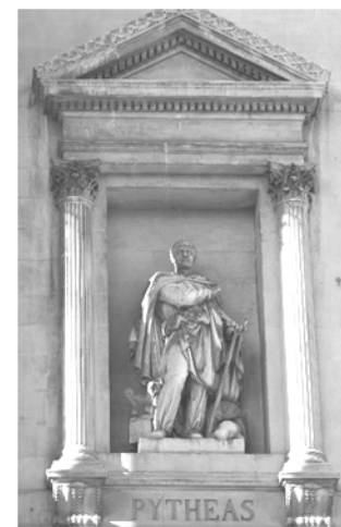
Doc. 2 : Détail de la façade du Palais de la Bourse.