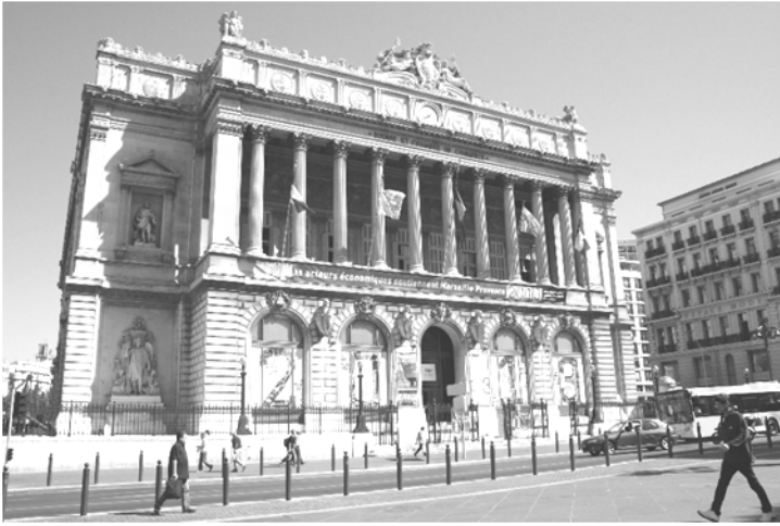
Doc. 1 : Façade du Palais de la Bourse, Marseille.