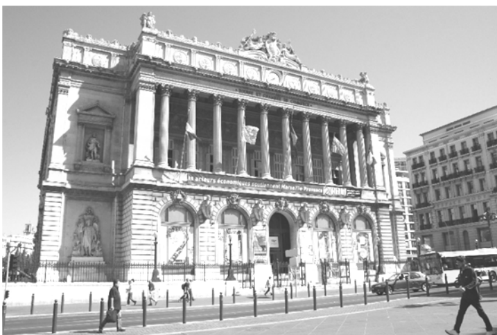
Doc. 1 : Façade du Palais de la Bourse, Marseille.