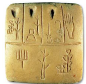
Tablette en pierre calcaire, découverte en Mésopotamie

Pour écrire, il fallait donc en connaître des milliers !