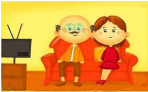
the living room